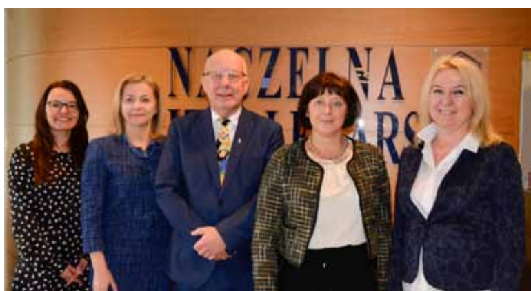
PTS i NIL będą ściśle współpracować

Podczas spotkania omówiono także zamierzenia na najbliższy czas, w tym plany wspólnych szkoleń Ośrodka Doskonalenia Zawodowego Naczelnej Izby Lekarskiej z zakresu diagnostyki radiologicznej (szkolenie z CBCT) i laseroterapii w stomatologii.