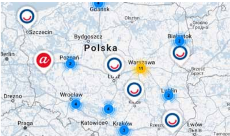
Mapa kampanii „Polska mówi: aaa”